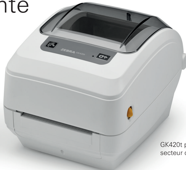
GK420t pour le secteur de la santé