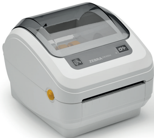
GK420d pour le secteur de la santé